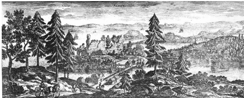
Almare-Stäkets ruin. Kopparstick efter teckning av Erik Dahlberg i hans Suecia antiqua et hodierna, utgiven vid 1600-talets mitt.