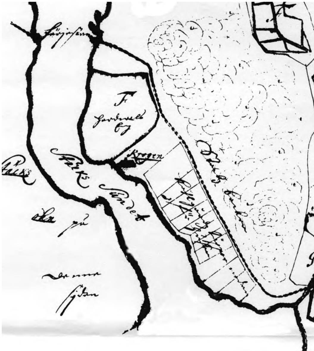
Del av 1690 års karta över området vid Stäketsundet.

Färjan har 1690 fortfarande samma plats och marken i anslutning till östra färjeläget har inte någon speciell beteckning.