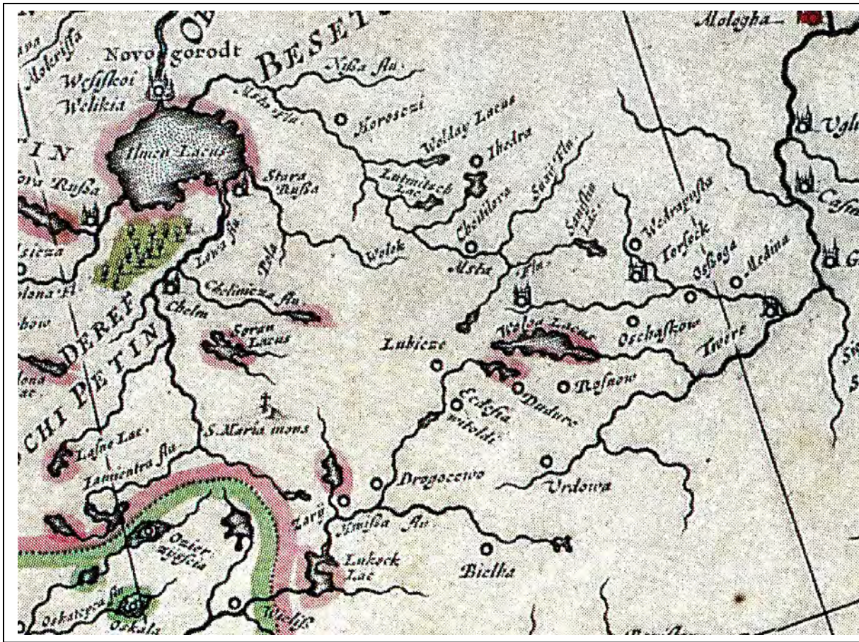
Karta ritad av Anders Bure. Utgiven av Blaeu omkring 1635

Ur Sverige och de skandinaviska länderna av Ermen / Mingroot