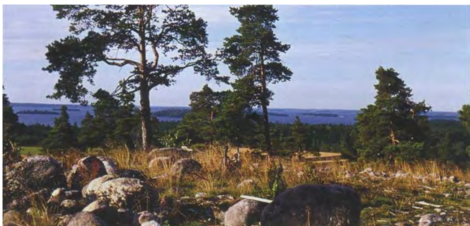
Gravfältet vid Rösaring i Låssa är skönt beläget med utsikt Mälarsikt.